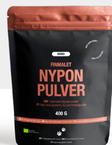
Finmalet Nyponpulver Hund Eko 400g Art.nr. 60609904