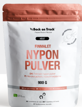
Finmalet Nyponpulver Häst Eko 900g Art.nr. 60809909