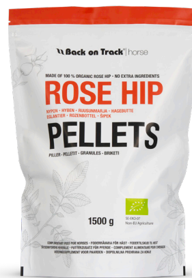
Nyponpellets Häst Eko 1500g Art.nr. 60559903