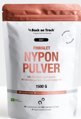
Finmalet Nyponpulver Häst Eko 1500g Art.nr. 60809915