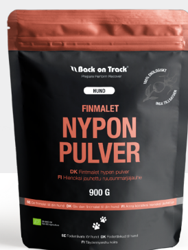
Finmalet Nyponpulver Hund Eko 900g Art.nr. 60609909