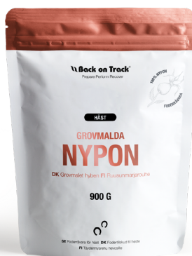
Grovmalda Nypon Häst 900g Art.nr. 60819909